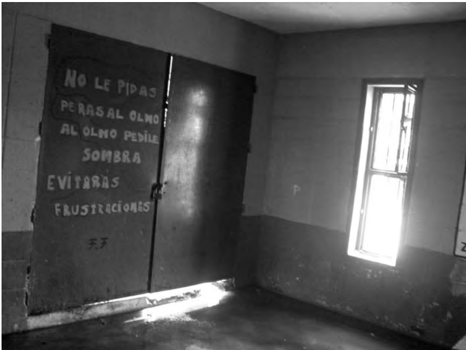
Puerta de ingreso de salón para recibir visitas y realizar otras actividades recreativas en uno de los módulos del entonces Complejo Carcelario de Santiago Vázquez (actual Compen), vista interior. Registro fotográfico: Fabiana Larrobla Caraballo, 2011.

Esta normativa era actualizada sistemáticamente pero su aplicabilidad radicaba en gran medida en el uso discrecional de la guardia de turno, lo que amplificaba la incertidumbre. Eran sometidas y sometidos al régimen de sanciones penitenciarias, coincidiendo con el planteo del historiador chileno Pedro Rosas respecto a que «las medidas administrativas carcelarias exacerban el castigo por sobre la penalidad» (2004: 186).