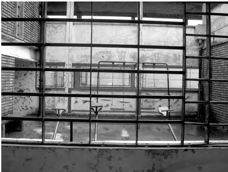
Patio interior para recibir visitas en uno de los módulos del entonces Complejo Carcelario de Santiago Vázquez (actual Compen), sin uso en ese momento por motivos de seguridad. Registro fotográfico: Fabiana Larrobla Caraballo, 2011.

La gran mayoría que se integra a través de la visita, está obligada dentro de la lógica de los done s por un imperativo de orden moral. Este imperativo moral se sustenta en la obligación de garantizar la circulación de dar, recibir y devolver (Mauss, 2009) que permite la cohesión familiar. De un tipo de familia que es condensada en el ejercicio de la maternidad.