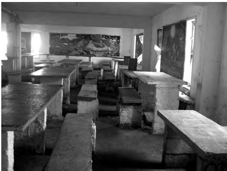
Salón interior para recibir visitas en uno de los módulos del entonces Complejo Carcelario de Santiago Vázquez (actual Compen). Registro fotográfico: Fabiana Larrobla Caraballo, 2011.

cárcel mientras, paralelamente, justifica estas penurias en el precio del cariño a un o una desviada. Justificación que no es pertinente enunciar precisamente por encontrarse fuera de los márgenes —los alambrados— establecidos.