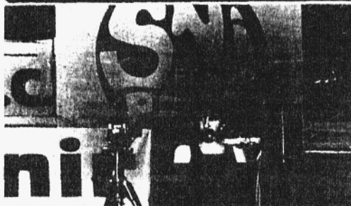
EDUCADORES FRANCESES SOLIDARIOS CON URUGUAY

Se podrían agregar muchos otros hechos, como por ejemplo el siguiente: el día 18 de setiembre, en la Iglesia Amsteikerk de Amsterdam, contrajo matrimonio una joven pareja holandesa. Sensibles y preocupados por lo que sucede en Uruguay, decidieron que la colecta de ese día en la Iglesia fuera íntegramente donada para los familiares de los presos políticos. Una joven amiga de los novios explicó esta decisión a los feliareses y como respuesta se recaudaron 600 florines, casi 250 dólares. Luego el pastor rezó por la felicidad de los novios y por los que sufren y luchan por la democracia en Uruguay. A. y R."