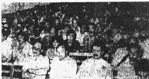
COOPERATIVISTAS DE VIVIENDA CRITICAN LA POLÍTICA DEL BANCO HIPOTECARIO Y RECLAMAN SOLUCIONES.

El "Uruguay Komitten" de Dinamarca participó activamente en la recolección de fondos en solidaridad con los presos políticos y de firmas con la exigencia de que sea respetada la voluntad del pueblo uruguayo. Distribuyó