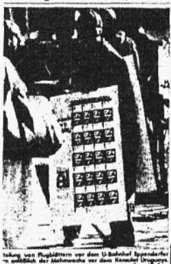
Reaktion von Mitgliedern vor dem U-Bahnhof Spandauer Tor während der Mahnwache vor dem Konsulat Uruguay.