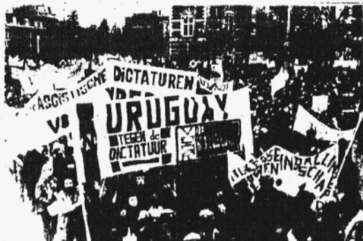
AL LLAMADO DE LA CONVENCION NACIONAL DE TRABAJADORES LA COLECTIVIDAD URUGUAYA EN HOLANDA PARTICIPO EN LA GIGANTESCA MANIFESTACION DE 400 MIL PERSONAS QUE SE REALIZO EN AMSTERDAM CONTRA LA INSTALACION DE LOS MISILES NUCLEARES NORTEAMERICANOS EN EUROPA. LOS CARTELES DE LA CNT DENUNCIARON LA DICTADURA URUGUAYA Y EL FASCISMO. PRONUNCIANDOSE POR LA PAZ MUNDIAL Y CONTRA LA CARRERA ARMAMENTISTA. EN LA FOTO: LOS URUGUAYOS EN LA MANIFESTACION DE AMSTERDAM.