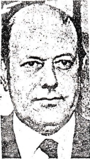
Dr. Luis A. Crisci, Ministro de Trabajo y Seguridad Social

A más de un mes de serle entregada la carta de los trabajadores de ANCAP, en la que le fue solicitada la autorización para asociarnos gremialmente, el Sr. Ministro de Trabajo no se ha dignado a contestarnos. Como ya es norma, el secretario de estado desconoce sistemáticamente (jamás ha recibido al P.I.T.) todo planteo realizado por los trabajadores. Enemigo acérrimo del derecho de huelga, se ha manifestado más de una vez en favor del diálogo.